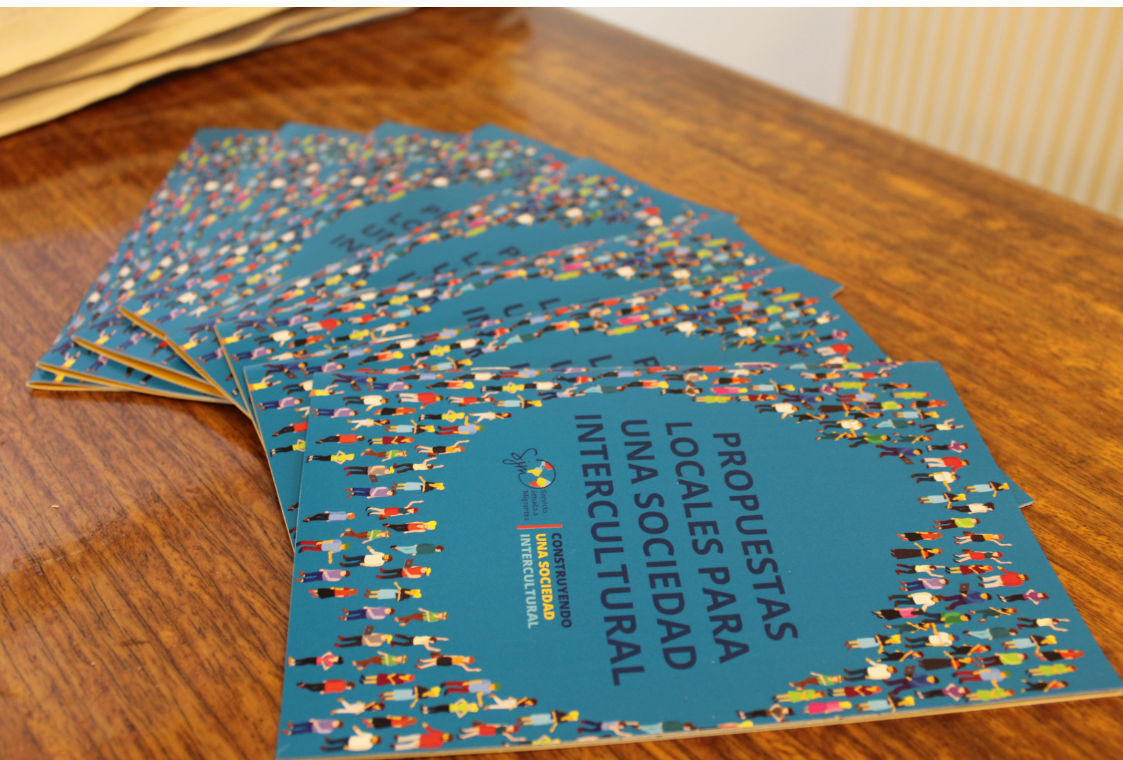
Registro fotográfico Propuestas Locales para una Sociedad Intercultural.

El cierre del proceso se materializó a través de 5 Hitos Regionales durante los meses de agosto y octubre de 2023, donde se entregaron las propuestas a nivel regional confeccionadas por los participantes del proceso participativo. Estos eventos contaron con la presencia de alcaldes, directores regionales de Sermig, Seremis y concejales. Además, se diseñaron 5 cuadernillos por región que recopilaron las propuestas señaladas durante el proceso.