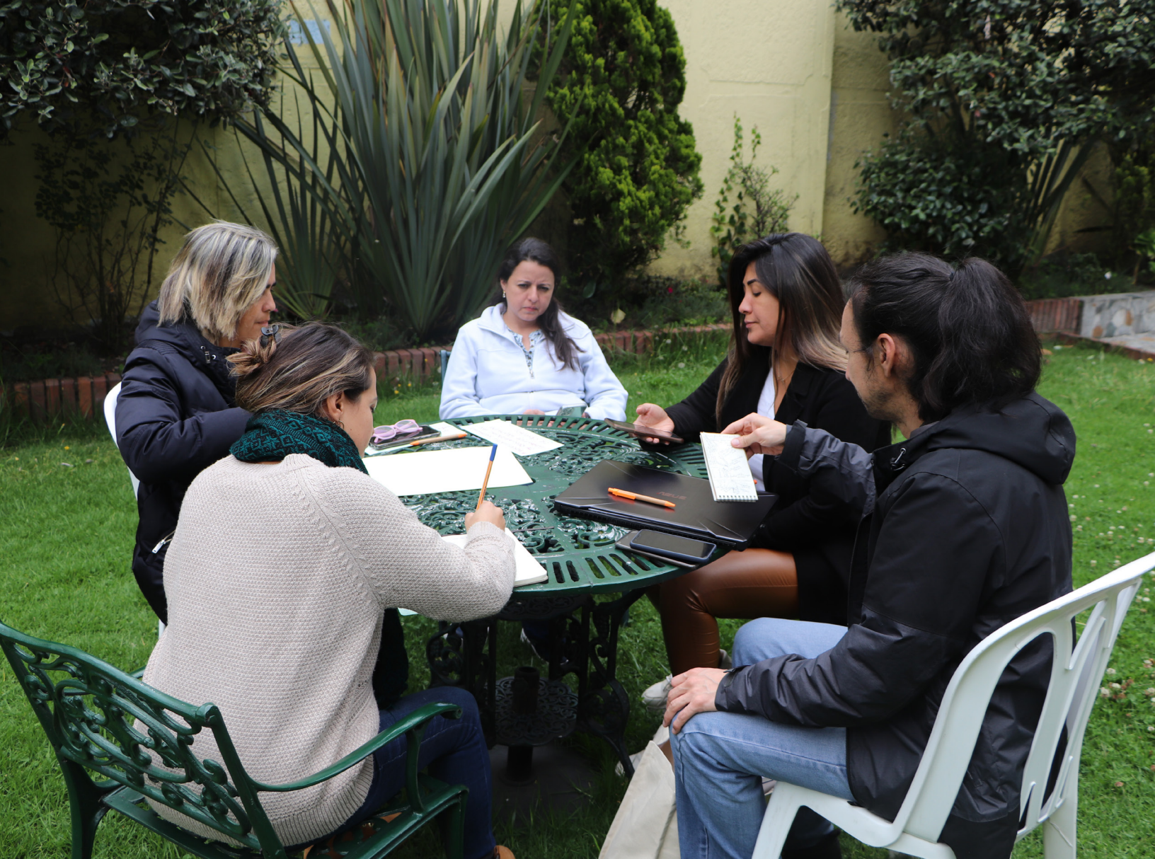
Registro fotográfico instancias de participación, Encuentro Latinoamericano, Agosto 2023.