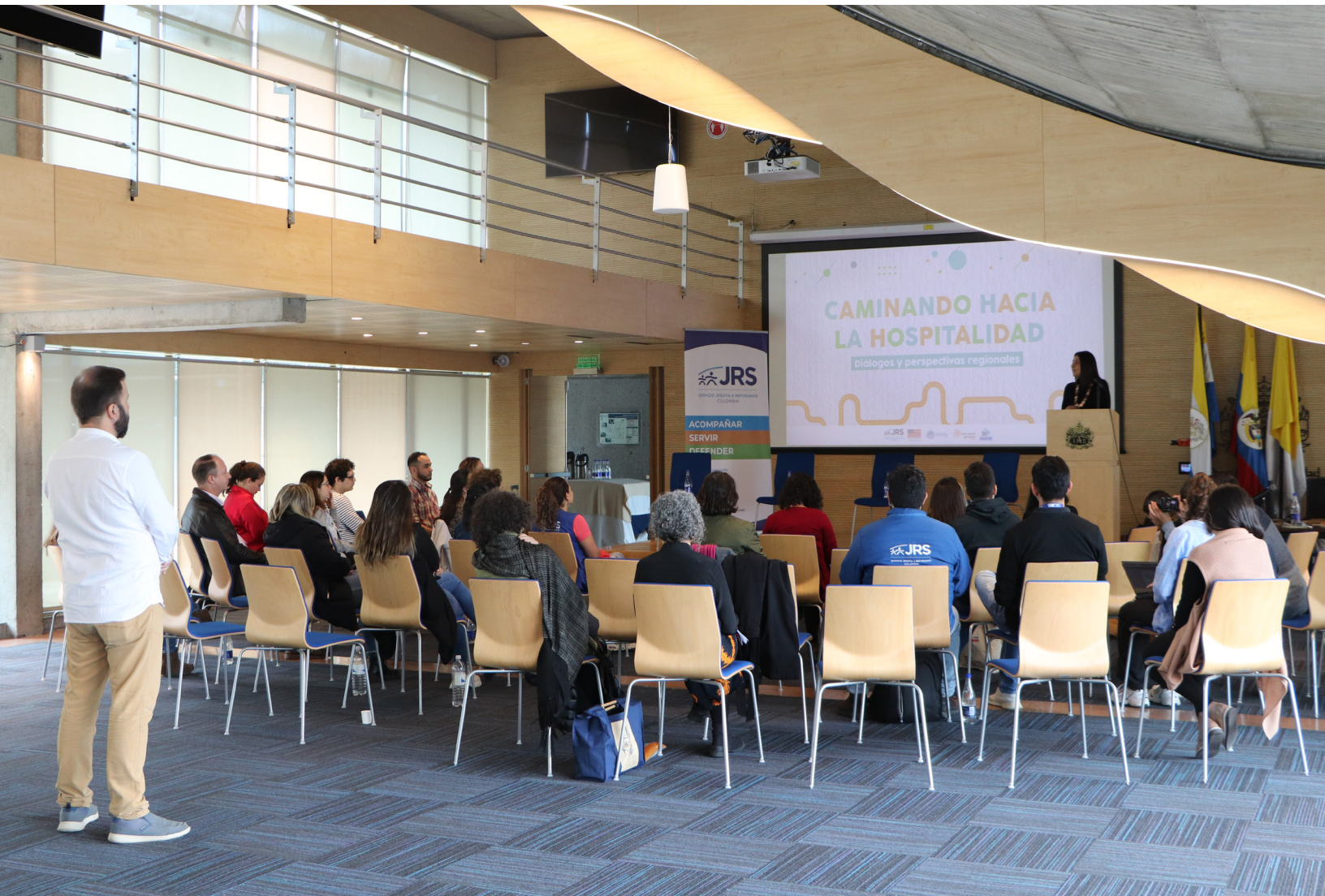
Registro fotográfico instancias de presentación, Encuentro Latinoamericano, Agosto 2023.