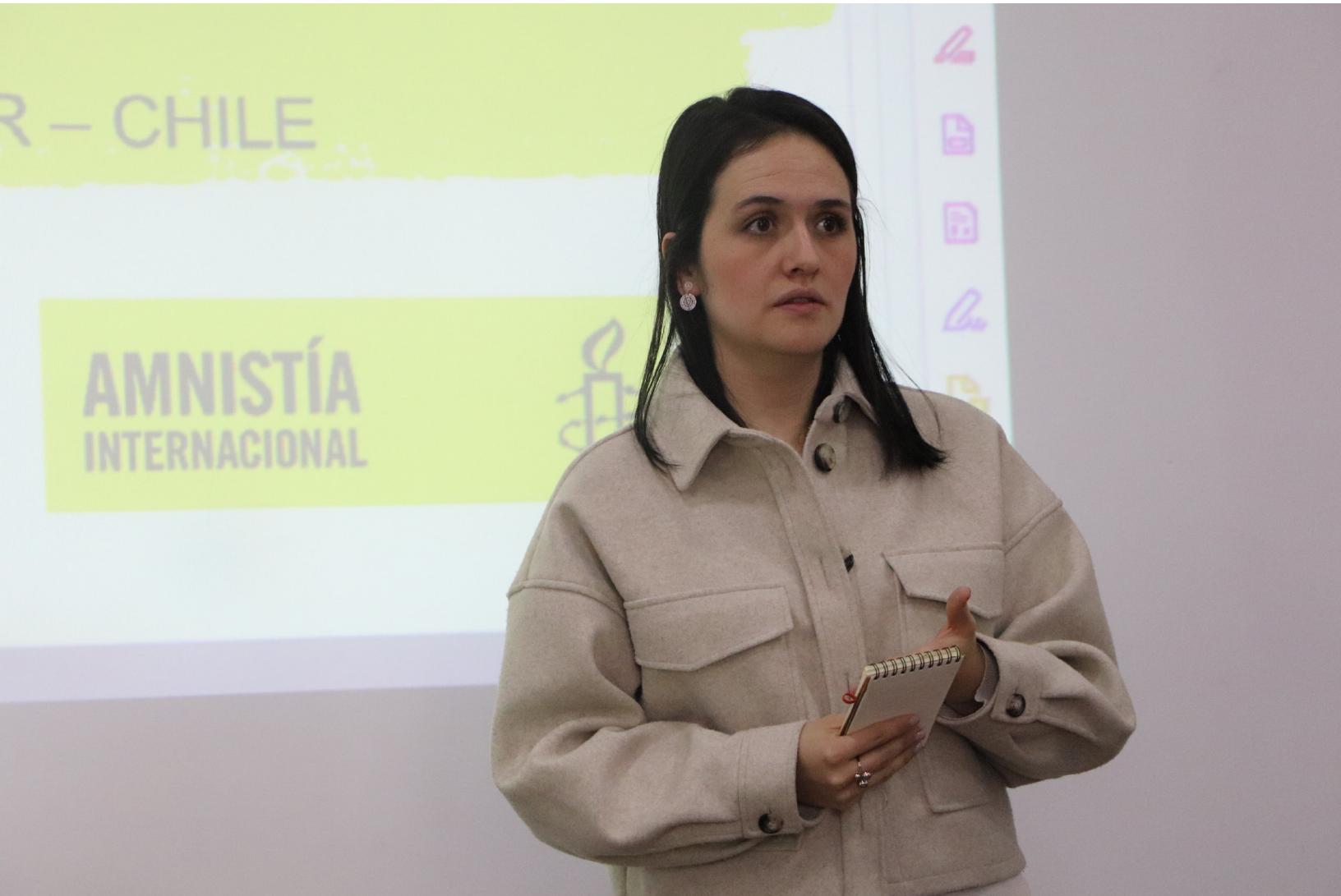
Registro fotográfico presentación Amnistía Internacional Perú, Encuentro Latinoamericano, Agosto 2023.