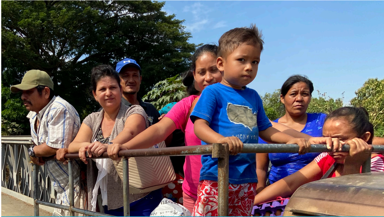
Family safely crossing the Rio Roldan on a bridge built as a result of a grassroots organizing campaign by Comunidades de Fe Organizadas en Acción (COFOA).