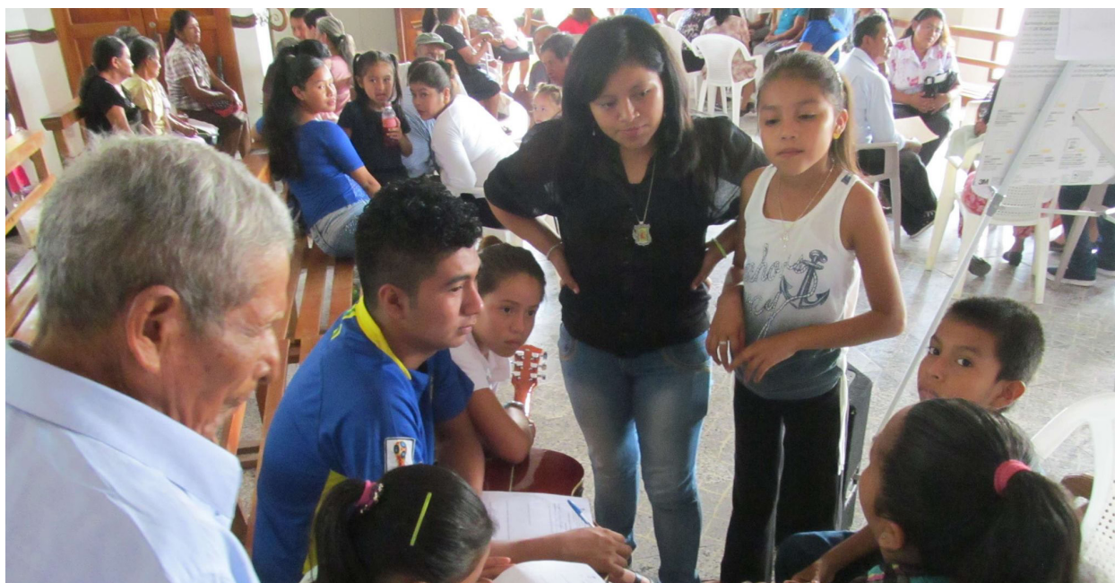
Grassroots community meeting in Honduras.

Una forma de la cual los Estados Unidos puede abordar rápida y eficazmente la migración irregular de la región es emitiendo más visas temporales de trabajo, combinadas con mayores protecciones laborales. La Administración ha progresado al proporcionar más visas temporales de trabajo a los trabajadores de Centroamérica, pero estas siguen siendo insuficientes en escala y relativo a las exigencias del mercado laboral estadounidense. El número de trabajadores del norte de Centroamérica que recibió visas temporales incrementó de 11.000 en el 2021 a casi 20.000 en el 2022. En base a la revisión de las investigaciones por el Migration Policy Institute y los datos sobre las personas del norte de Centroamérica que han llegado a la frontera con EE.UU., calculamos que los EE.UU. necesita emitir más de 50,000 visas temporales de trabajo a los migrantes de la región.