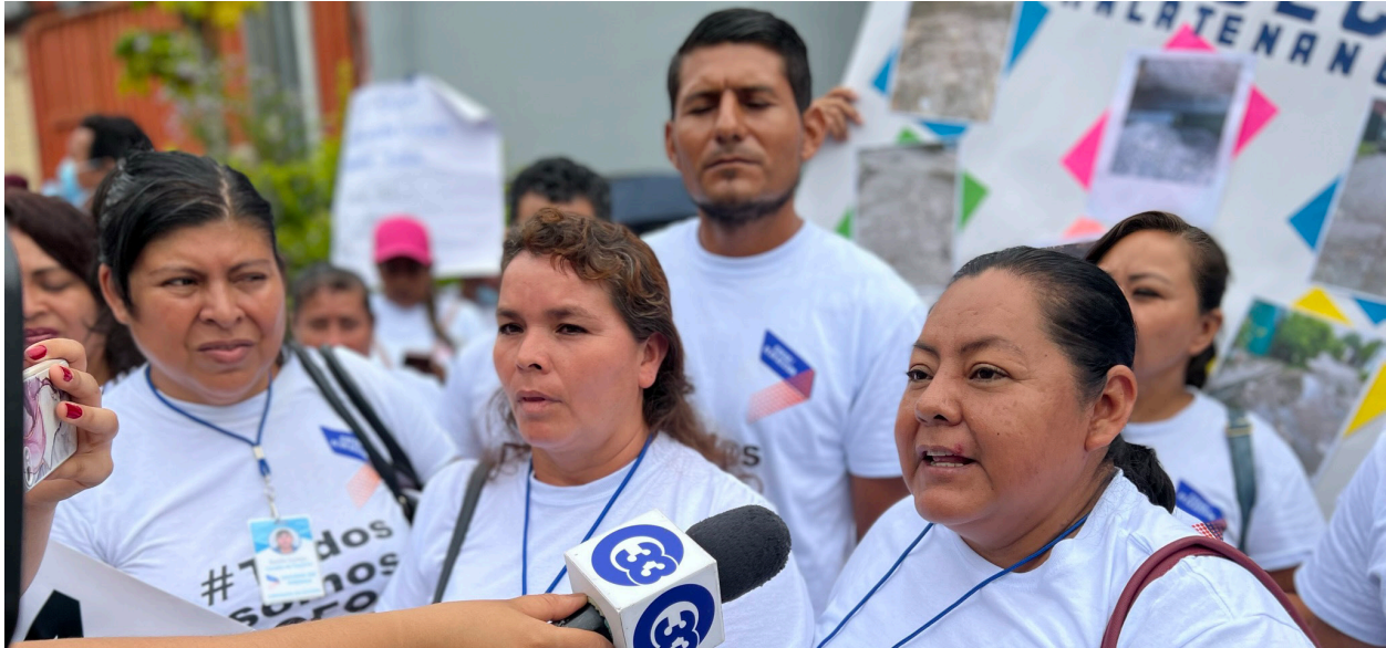
Public demonstration at Salvadoran Ministry of Municipal Works to press government to release funding designated for community development.

personas que tengan que huir de sus hogares. En segundo lugar, hasta la fecha, el Llamado a la Acción de la Administración carece de transparencia e informes detallados, incluyendo cronologías firmes para las inversiones, y no existen mecanismos para que las organizaciones de la sociedad civil monitoreen las inversiones del Llamado a la Acción. Muchas veces, la información que la Administración actualiza sobre las inversiones del Llamado a la Acción incluye empresas que no aparecían en las declaraciones y hojas informativas previas, haciendo que sea difícil de comprender la relación entre las promesas y las inversiones actuales.