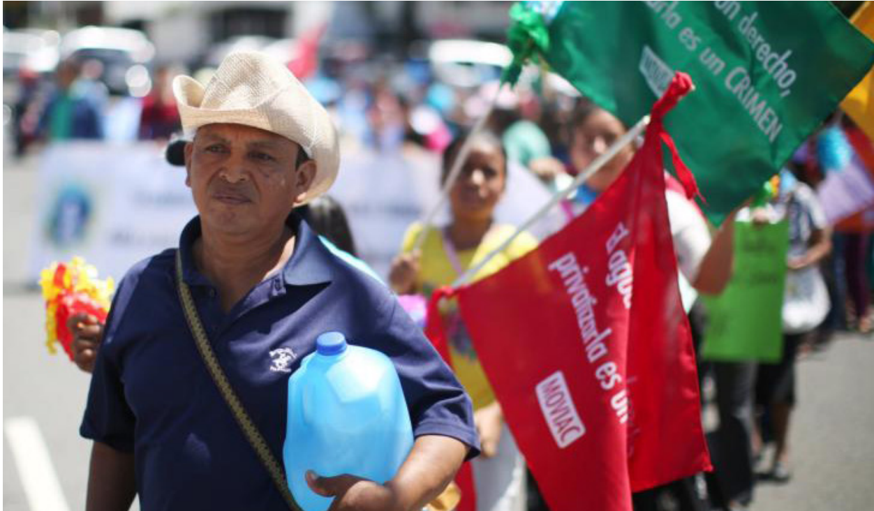
March against water privatization in El Salvador.