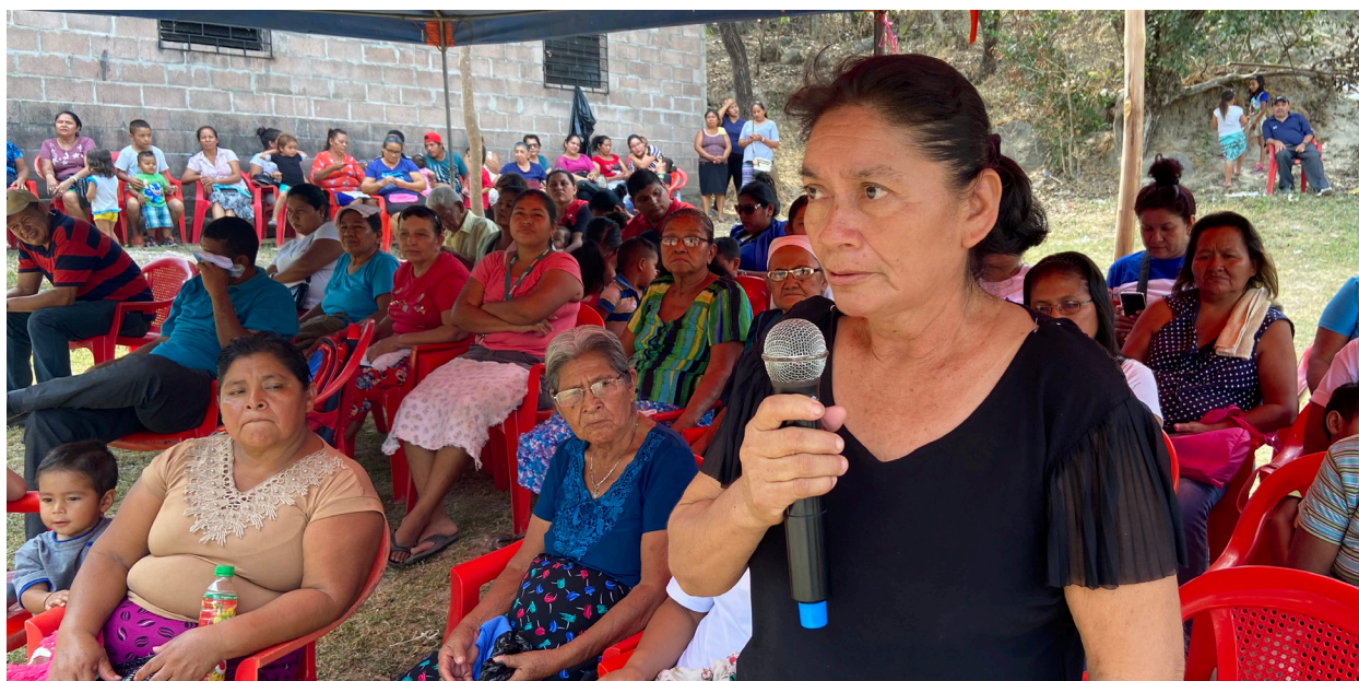
Leaders from the La Ponderosa subdivision in El Salvador organizing to win titles to their land and bring clean water, paved roads and other infrastructure to their community.

los sectores públicos y privados involucrados en la estrategia; (3) evaluar la política migratoria estadounidense en relación a las causas raíz de la migración; y (4) proponer alternativas políticas. Este informe utiliza una encuesta de cincuenta organizaciones (resultados en Apéndice), un análisis de los 4.2$ mil millones en fondos públicos y privados comprometidos a la estrategia, datos sobre las visas de trabajo estadounidenses y las sanciones económicas en la región, y una revisión de 26 declaraciones de la Administración Biden sobre la migración y el desarrollo en la región. Cubrimos cuatro temas principales: Democracia y el Estado de Derecho, Desarrollo Sostenible y Liderado Localmente, Política Económica Inclusiva, y Política de Migración Humana. De manera transversal en cada una de estas áreas, nos enfocamos en el grado al que la política de EE.UU. responde a las aportaciones de los actores de la sociedad civil y aborda las causas subyacentes de la migración forzada, incluyendo el cambio climático.